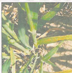
Bygrust på vårbygplantens nederste blade.

tagelige sorter fra vækststadium 30 ved over 10 procent angrebne planter. Bybladplet bekæmpes i vækststadium 30-